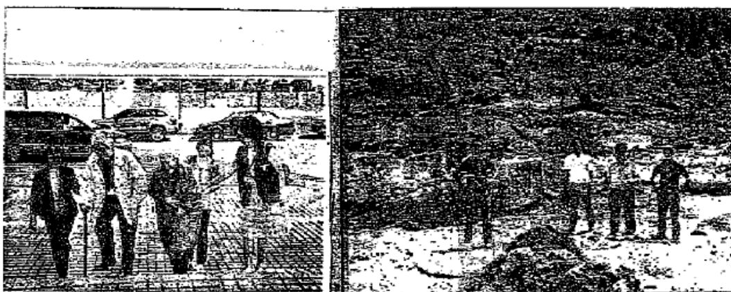
說明：右圖相片為中華民國 42 年前首次登上釣魚台宇業熒、蔡篤勝、姚琢奇、劉永寧四位壯士。左圖相片，1970 年策劃登釣魚台，中國時報名記者團召集人陸珍年伉儷（中間）、赴國立清華大學參加“國際論壇”。

註：以上相片是當年登釣魚台，現擔任各報社軍事媒體組成的“軍事研究會”會長，現今 83 歲姚琢奇壯士台北傳真。